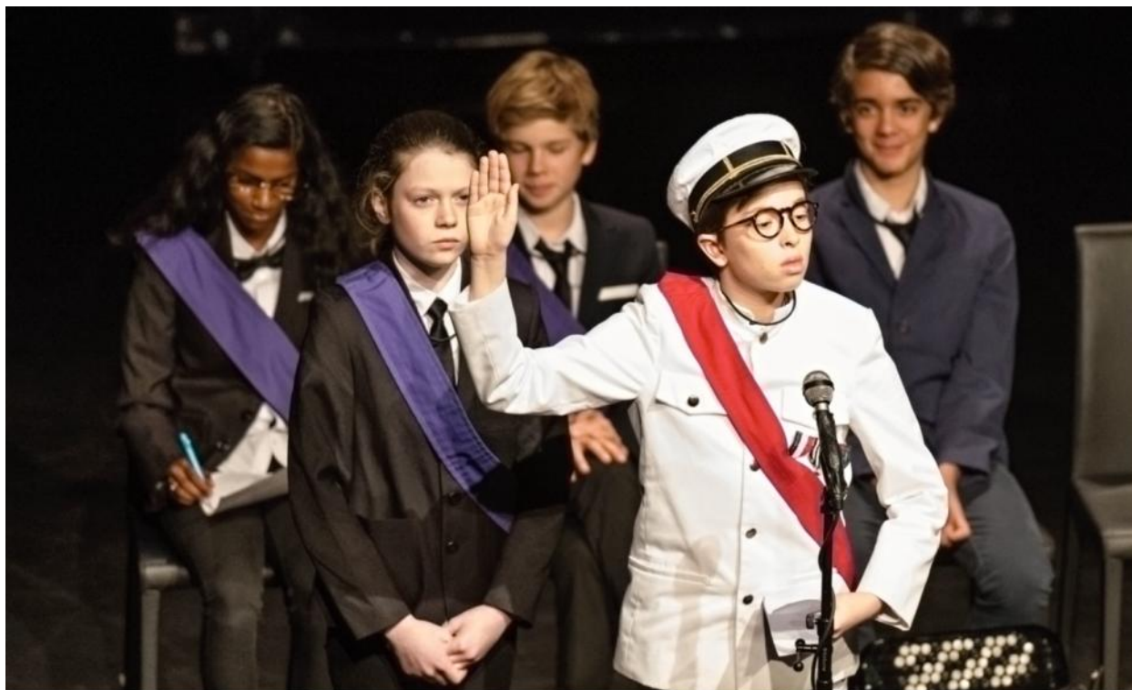
Institute of Political Murder, CAMPO Gent Milo Rau: Five Easy Pieces Režie / Regie: Milo Rau Divadlo Archa / Theater Archa