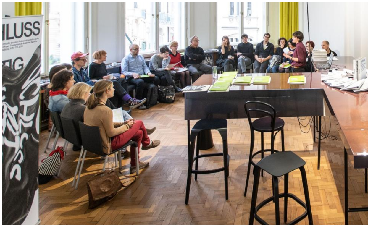
Goethe-Institut, theater.cz theatertreffpunkt prag Mezinárodní divadelní platforma / Internationale Theaterplattform Goethe-Institut