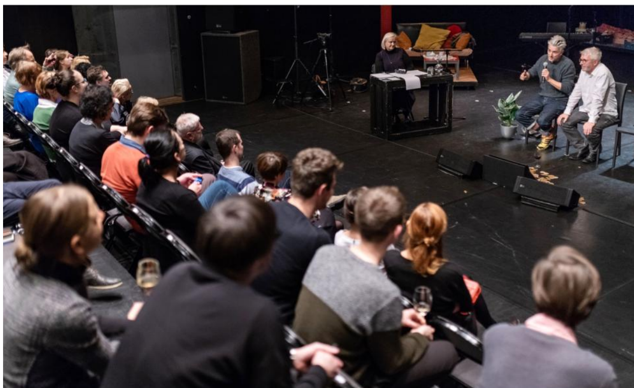
Five Easy Pieces Diskuse s diváky / Publikumsgespräch Divadlo Archa / Theater Archa Off-program / Off-Programm