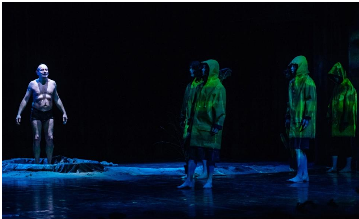
Independent Little Lies, Luxemburg Claire Thill: Blackout Režie / Regie: Claire Thill Divadlo Komedie / Theater Komödie