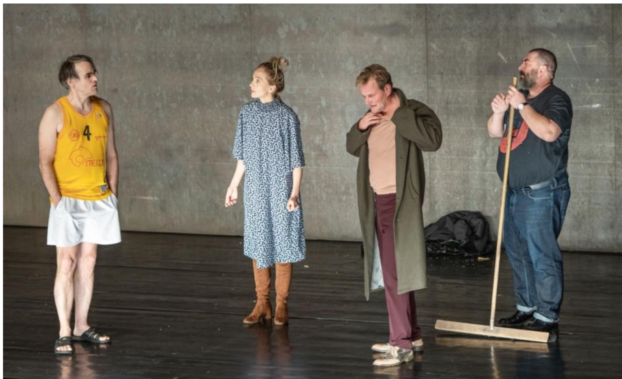
Thorsten Lensing David Foster Wallace: Nekonečný žert / Unendlicher Spaß Režie / Regie: Thorsten Lensing Nová scéna Národního divadla / Neue Bühne des Nationaltheaters