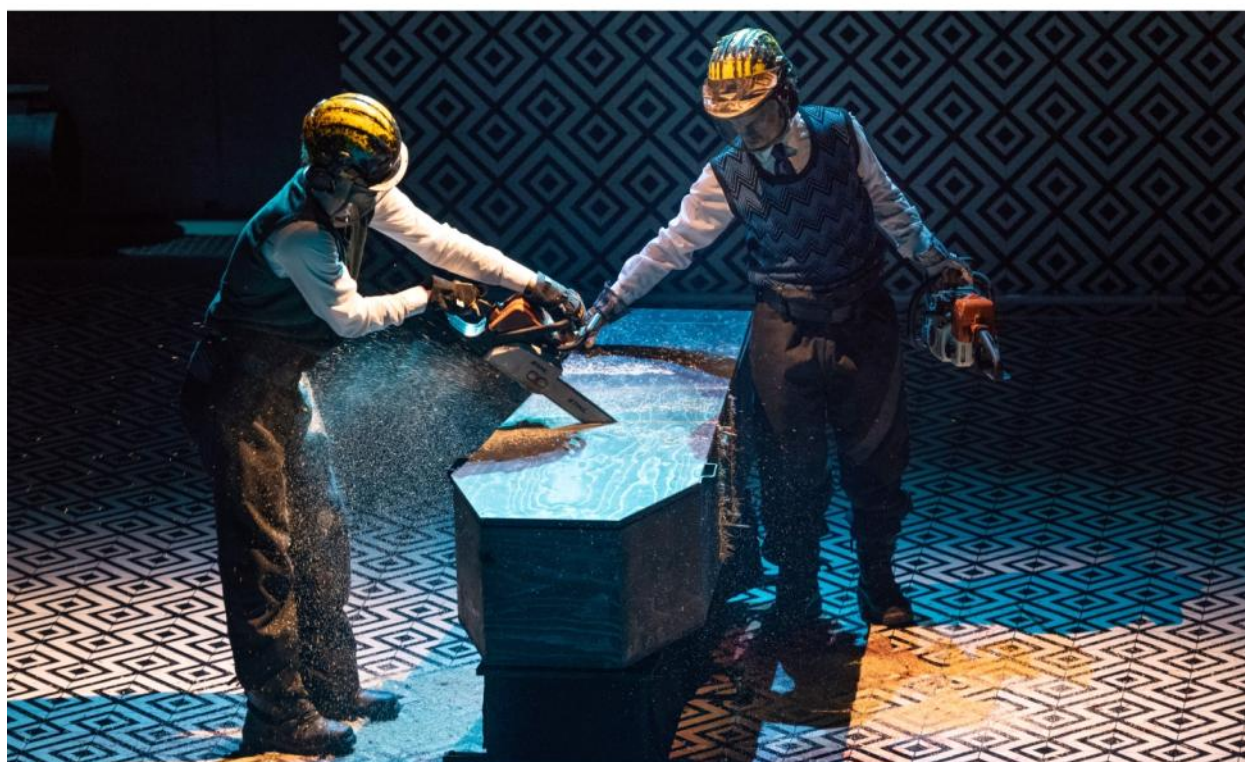
Thalia Theater Hamburg Podle Homéra / Nach Homer: Odysea / Die Odyssee Režie / Regie: Antú Romero Nunes DOX+