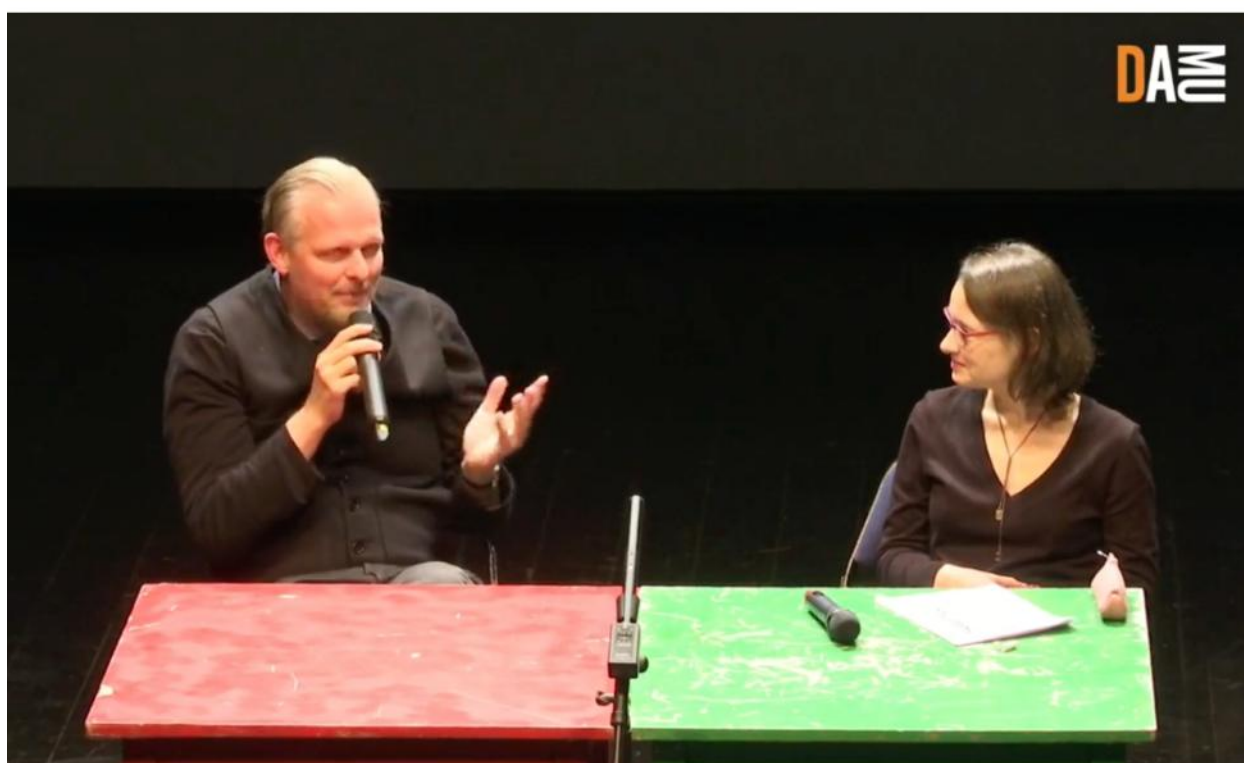
DAMU, theater.cz Thomas Ostermeier a jeho režijní metoda / Thomas Ostermeier und seine Regiemethode Přednáška / Vortrag Divadlo DISK / Theater DISK