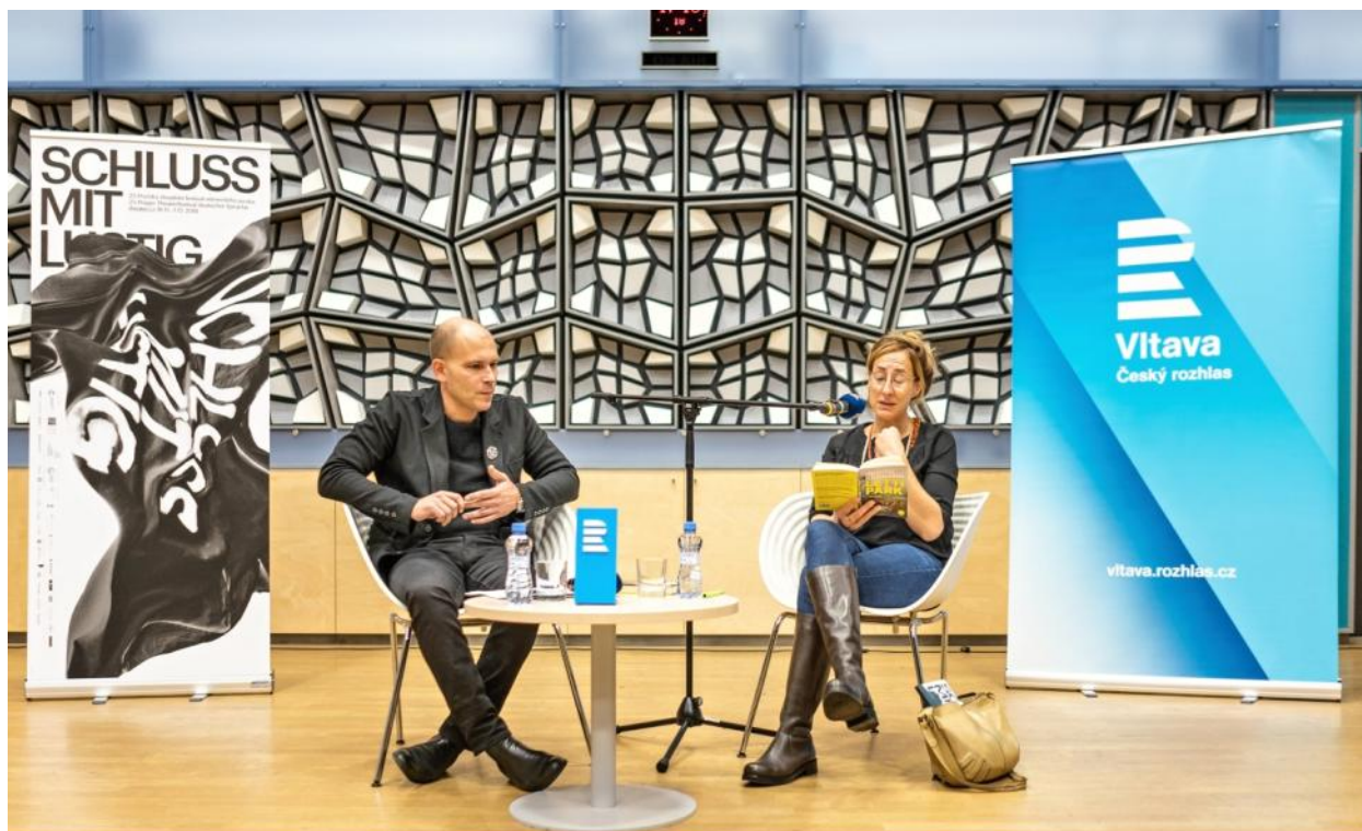
Judith Hermann Autorské čtení z nové knihy povídek Lettipark Autorenlesung aus dem neuen Erzählungsband „Lettipark“ Studio 1 Českého rozhlasu / des Tschechischen Rundfunks