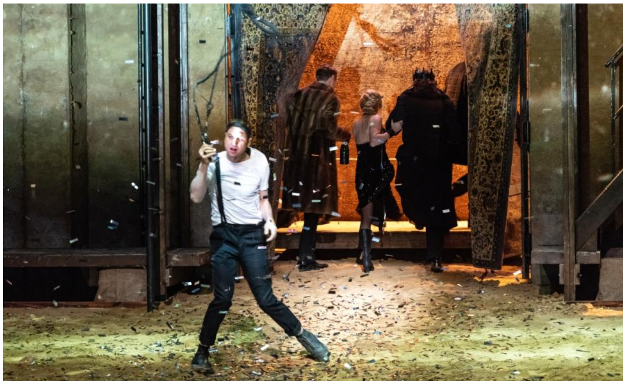
Schaubühne Berlin William Shakespeare: Richard III. Režie / Regie: Thomas Ostermeier Stavovské divadlo / Ständetheater