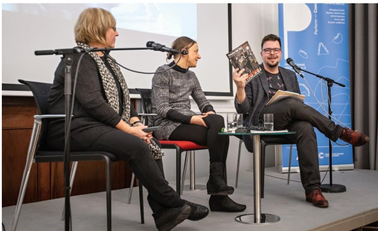
Goethe-Institut, theater.cz „Theater der Zeit“ - Prezence „českého čísla“ divadelního časopisu Theater der Zeit Präsentation der „tschechischen Nummer“ der Zeitschrift „Theater der Zeit“ V rámci / Im Rahmen: theatertreffpunkt prag Goethe-Institut