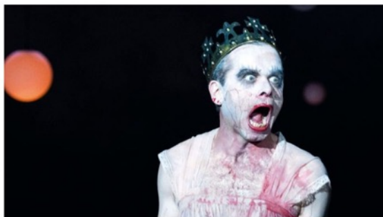
Snímek z inscenace Richard the Kid & the King.