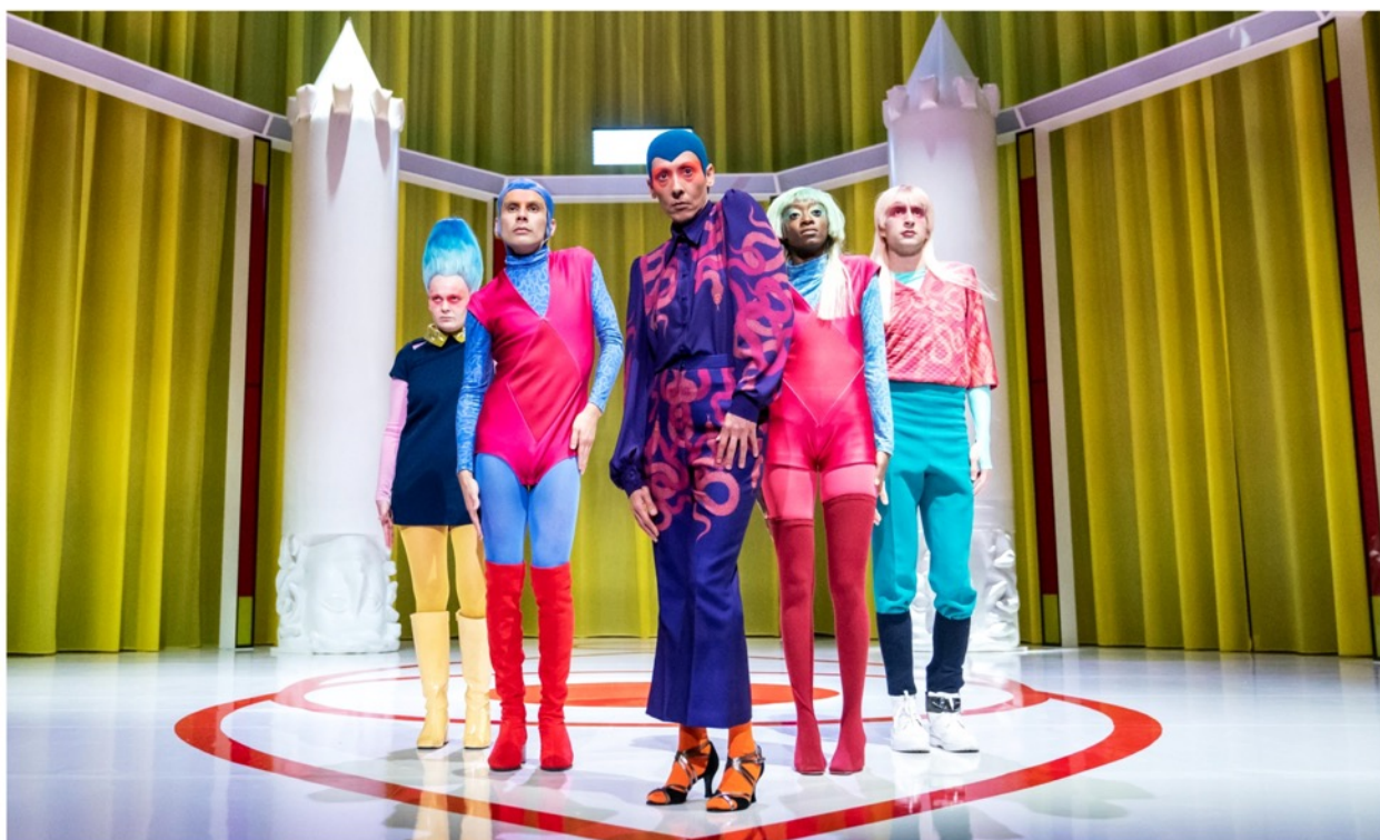
Münchner Kammerspiele Sivan Ben Yishai: Like Lovers Do (Memoáry Medúzy) Režie / Regie: Pinar Karabulut