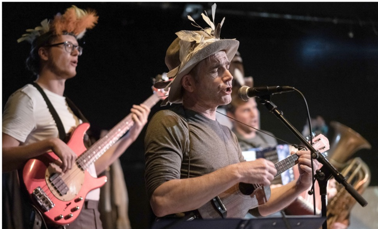
To téma / Das Thema & JODELIX Česko-německé transfolkinfúze / Deutsch-tschechische Transfolkinfusion: Písňozávod / Liedfabrik Off-program / Off-Programm