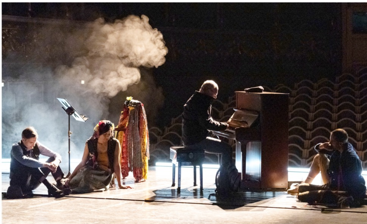
Koprodukce / Koproduktion: Národní divadlo, theater.cz Petra Tejnorová, Nina Jacques, Jan Tošovský a kolektiv/und Kollektiv: Stavovské národu! / Das Ständetheater dem Volke! Režie / Regie: Petra Tejnorová