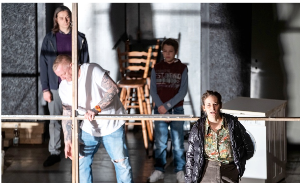
Schauspiel Hannover podle / nach Christian Baron: Muž své třídy/ Ein Mann seiner Klasse Režie / Regie: Lukas Holzhausen