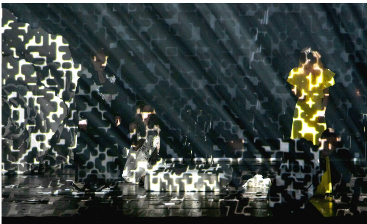
Volkstheater Wien Gerhart Hauptmann: Osamělé duše / Einsame Menschen Režie / Regie: soubor / Ensemble, Jan Friedrich, Kay Voges